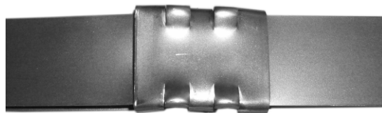
Podwójne nacięcie na spince zamkniętej